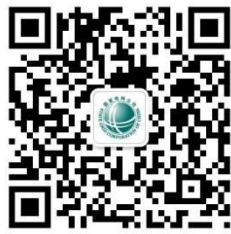
网上国网 95598 微信公众号