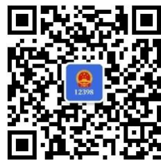
12398 能源监管 热线微信公众号